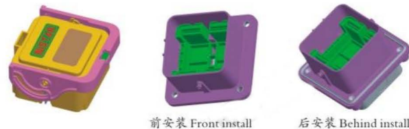
前安装 Front install